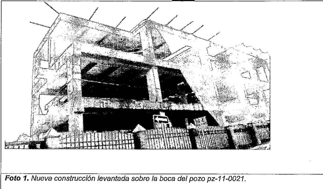
Foto 1. Nueva construcción levantada sobre la boca del pozo pz-11-0021.